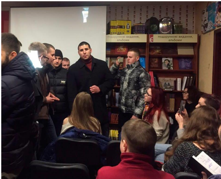
Рисунок 9. Блокування лекції про ЛГБТ рух у Харкові (кейс 1130).

У травні знову "Фрайкор", а також угруповання "Традиція і порядок" зірвали лекцію щодо гомофобії, організовану "Сферою". Поліція знову бездіяла.