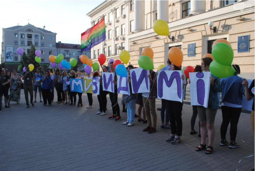
Рисунок 5. "Веселковий флешмоб" у Запоріжжі, 16.05.2018.

центром міста з веселковим прапором ЛГБТ, із символікою ЛГБТ на обличчі та плакатами, на яких зокрема було написано "Как можно ненавидеть за способность любить?". Одна з учасниць ходи постраждала від нападу невідомого чоловіка, який її сильно штовхнув, відібрав плакат, розірвав його на шматки і викинув. 44