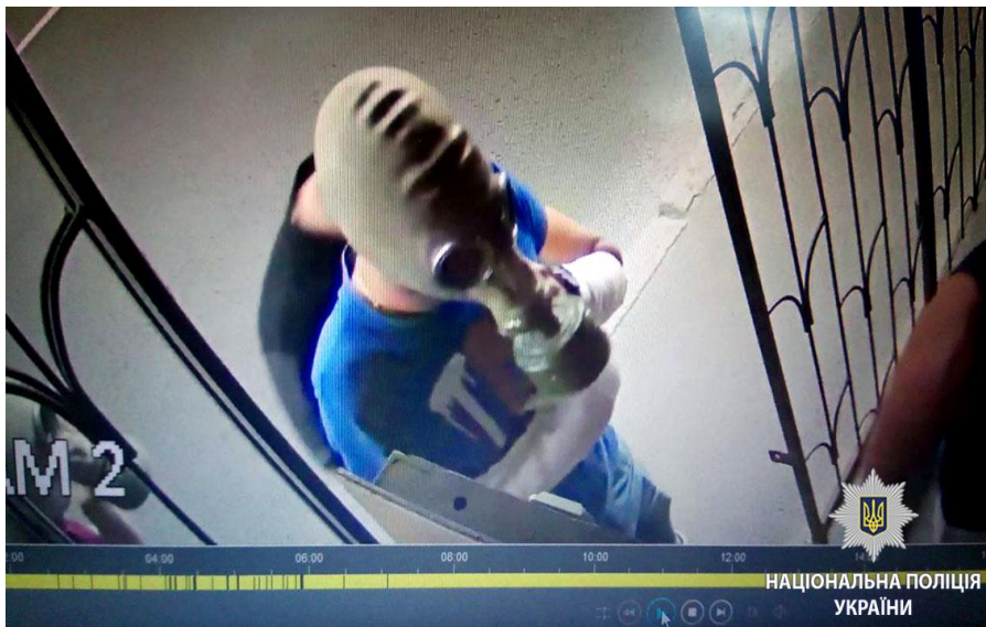
Рисунок 10. Напад на харківський ПрайдХаб (кейс 1254).

Поліція почала кримінальне розслідування за статтею 296 ККУ "Хуліганство". Мотив нетерпимості не був внесений до матеріалів розслідування.