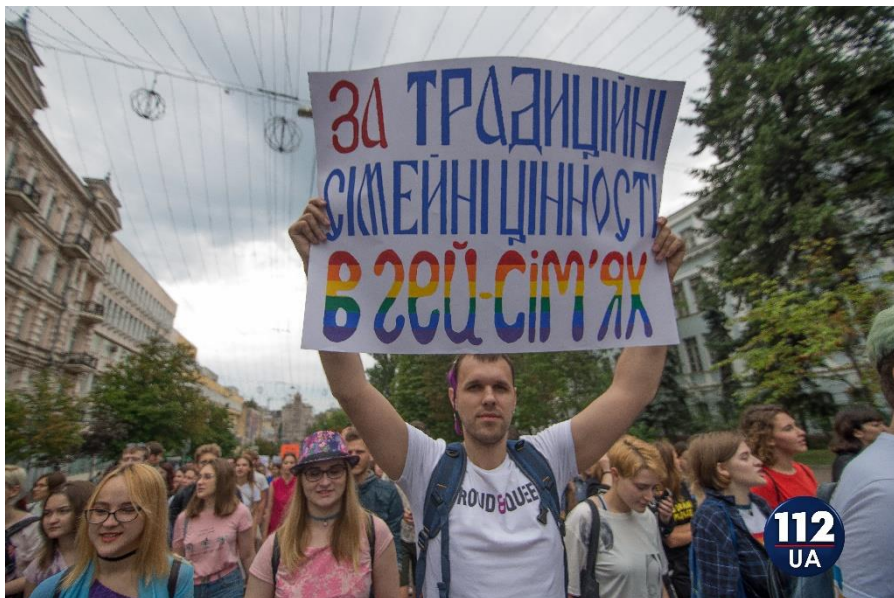
Рисунок 4. Учасник київського Маршу Рівності з плакатом "За традиційні сімейні цінності в гей-сім'ях", 17.05.2018.

представників Міністерства оборони, де розповів про свій досвід військової служби та відповідні проблеми, з якими він стикався як гей. З ще більшими проблемами стосовно військової служби стикаються трансгендерні люди, яким офіційно заборонено служити в українській армії – однак, як виявилось, вони також брали активну участь в опорі російській агресії як волонтери. 40