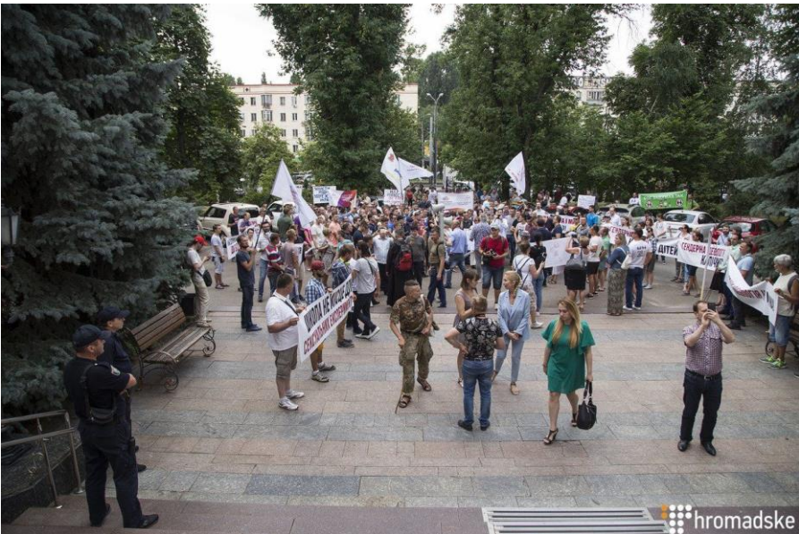
Рисунок 3. Мирний мітинг супротивників Маршу Рівності під Верховною Радою, 22.06.2018.

Праворадикальні націоналісти почали об'єднуватися з релігійними активістами у спробах блокувати проведення ЛГБТ заходів, однак власне релігійні активісти вдавалися до мирних форм протесту – таких, як ходи на "захист традиційної сім'ї" або мітинг під Верховною Радою проти проведення Маршів Рівності, що відбувся 22 червня і зібрав близько 300 учасників. Гасла учасників мітингу були підтримані народним депутатом від "Народного фронту" Юрієм Тимошенком. 24