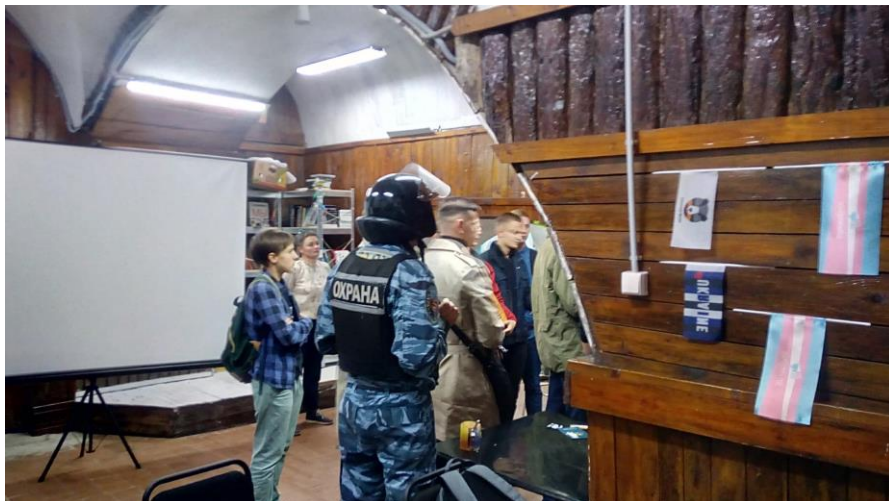
Рисунок 11. Блокування харківського ПрайдХабу (кейс 1326).