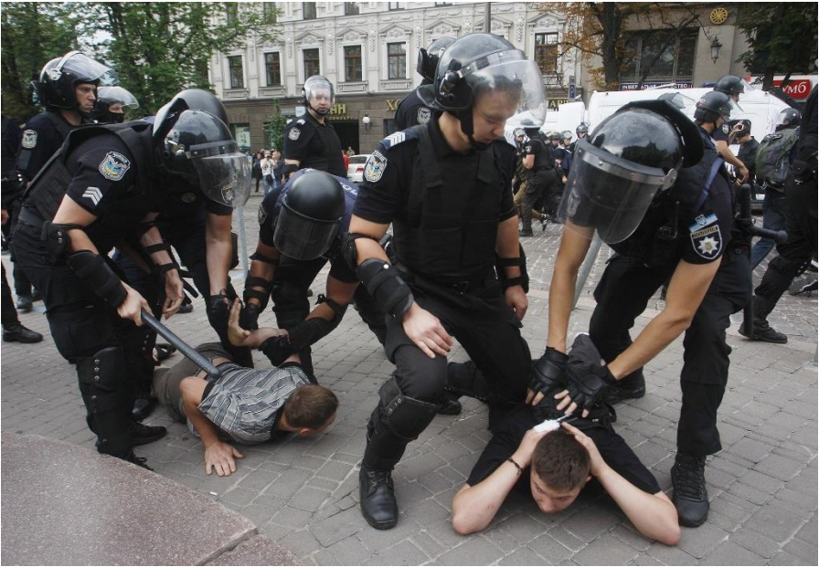
Рисунок 2. Поліція затримує супротивників Маршу Рівності у Києві, які намагалися силою перекрити його маршрут і чинили опір, 17.06.2018.

активістами, які до них примкнули. Більшість релігійних активістів мирно протестували обабіч маршу.