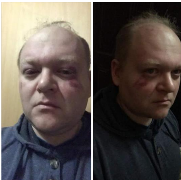
Рисунок 7. ЛГБТ активіст з Кривого Рогу після нападу невідомих (кейс 1102).

У липні один із цих активістів знову піддався нападу невідомих (кейс 1256). Цей злочин також досі не розкрито.