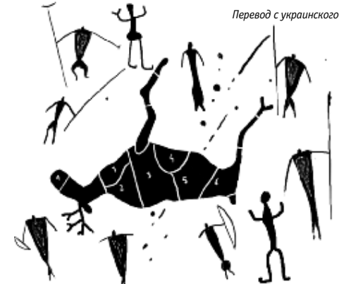
Перевод с украинского