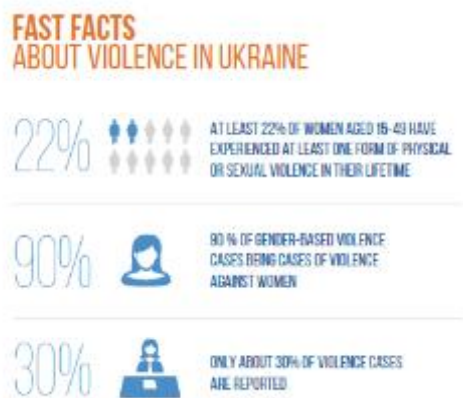
Рис. Факти про насильство в Україні 1

Віденська декларація і програма дій [ухвалені на Всесвітній конференції з прав людини (Відень, 25 червня 1993 року) (A/CONF.157/24, частина I, розділ III)] (частина I, пункт 18)